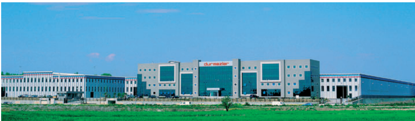
Head Quarter & Ataevler