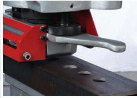
Пробивка швеллера, фланца и уголка