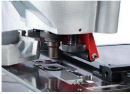
Станция пробивки имеет стандартный набор быстросменных держателей пуансона и матрицы, а так же устройство для съема.