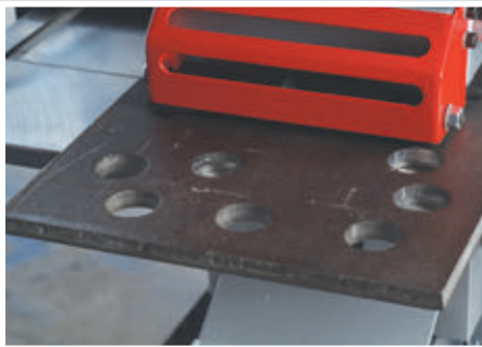
Пробивка листового проката