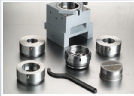
Пуансоны и матрицы различных размеров